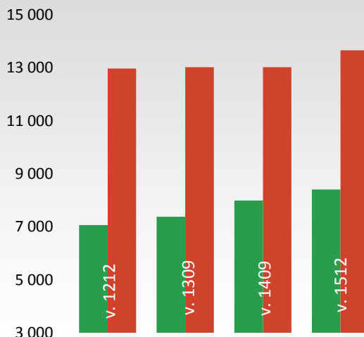
Délka značených turistických tras, cyklotras a cykloturistických tras v km

Z toho délka turistických tras pro pěší je 13 654 km a délka cyklotras a cykloturistických tras činí 8 406 km .